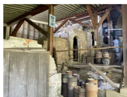
運河活用 (大岡川・中村川)

市内各地を対象に5つのテーマに分かれ、「まち歩き」と「意見交換」等を実施します。紹介する取組を通して、各々が抱える課題解決への糸口や活動のモチベーションに繋がります。