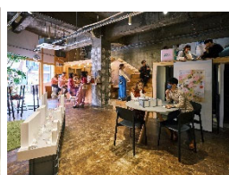
歴史的建造物 リノベーション (関内)