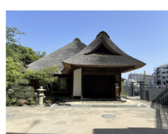
郊外観光の可能性 (金沢)

※開催内容や募集案内の詳細につきましては、次の横浜市都市デザイン室 HP をご覧ください。