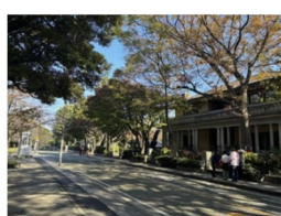
歴史資産の継承 (山手)