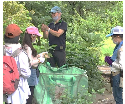
掲載している写真は昨年度の様子です。