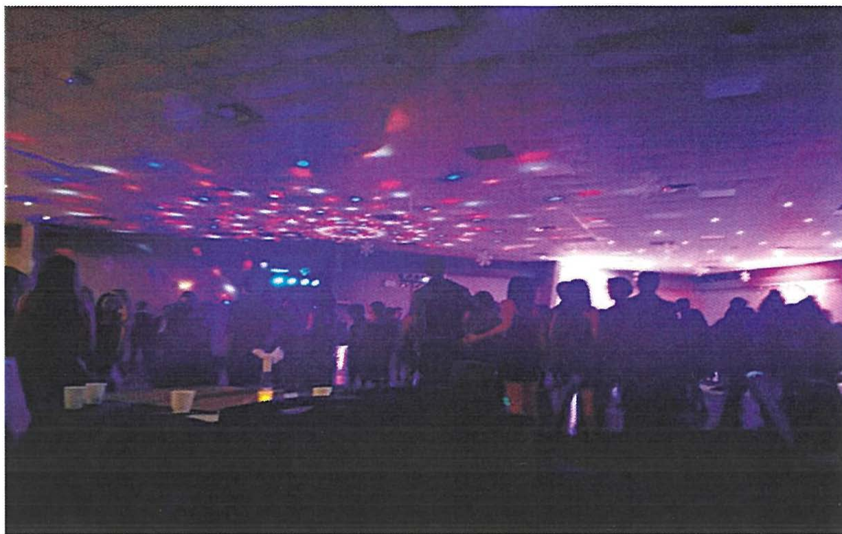
写真 2 <Winter Formal にて/12 月>