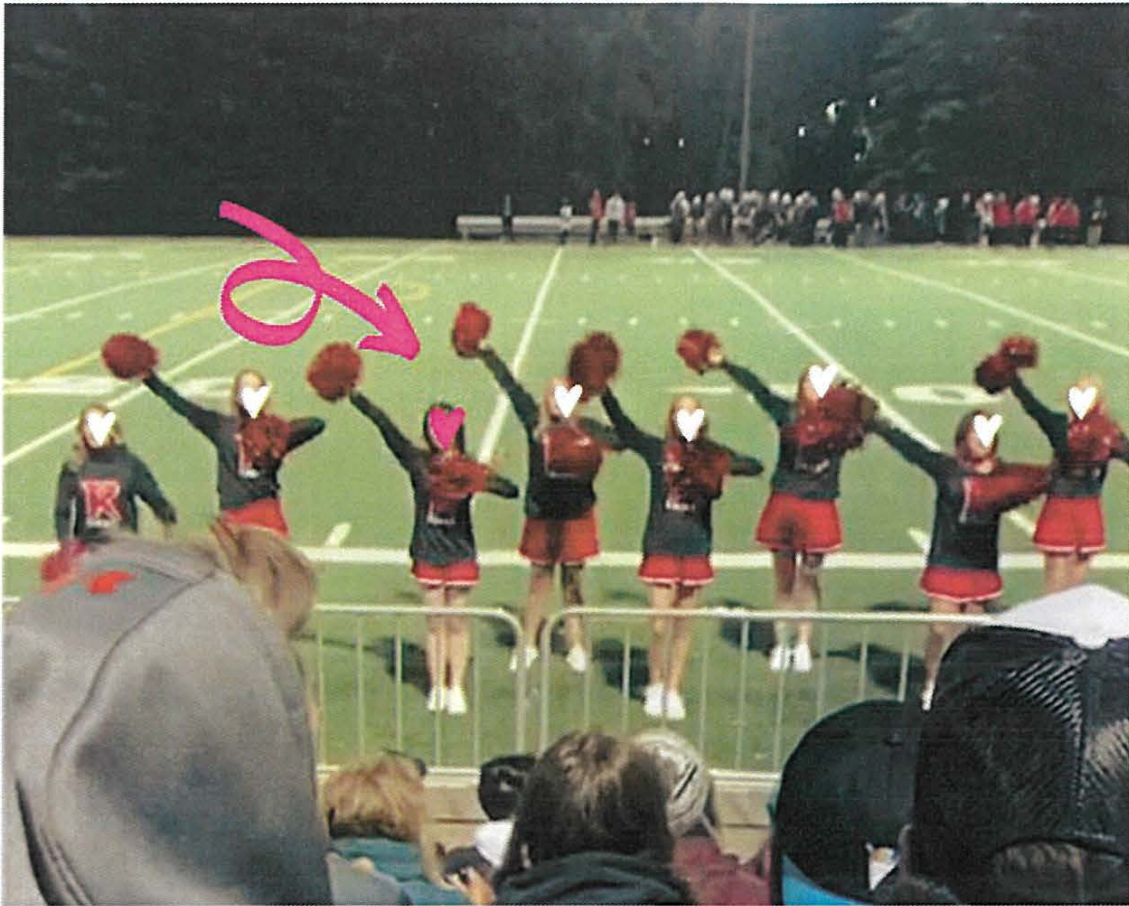
写真3 <チアリーディング フットボールの試合の応援にて/11月>