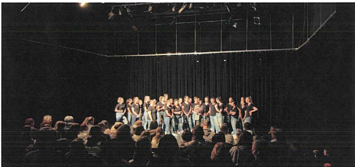
写真1 <ダンスの授業にて最終発表「ショーケース」/1月>

最後に、私の留学を様々な面でサポートしてくださったすべての方々にお礼申し上げます。ありがとうございました。