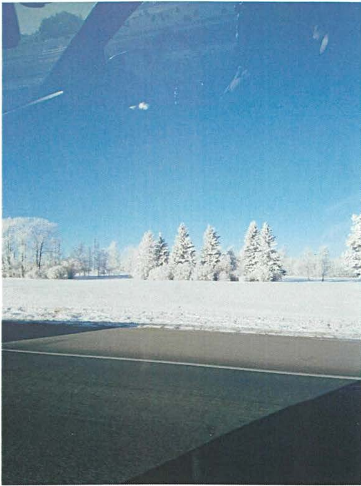
写真5 <カナダの雪景色>