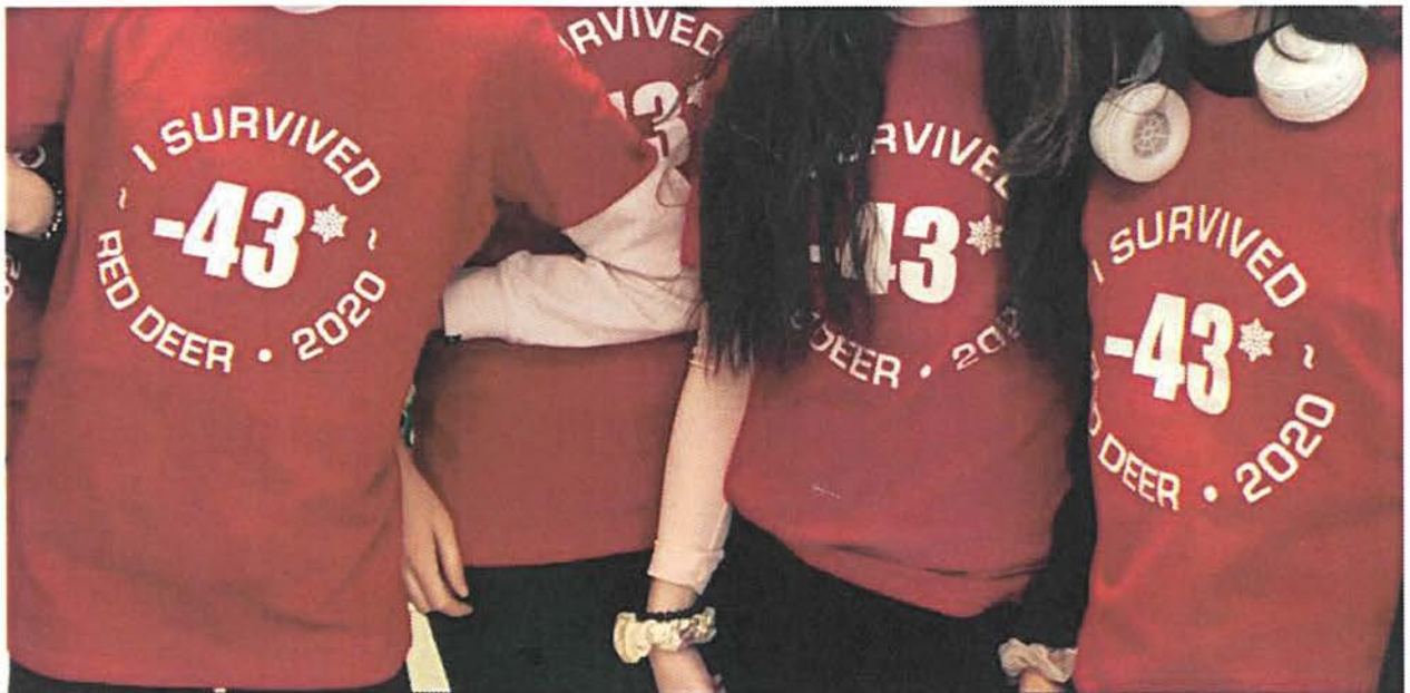
写真6 <最低気温記念の T シャツ / -43°C を生き延びました>