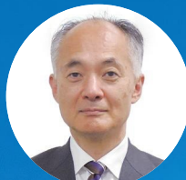
辻 琢也氏 一橋大学大学院 法学研究科教授