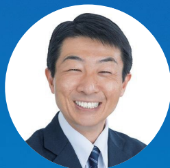
古川 直季氏 総務大臣政務官