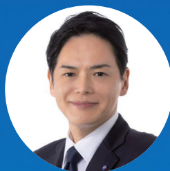
山中 竹春 横浜市長