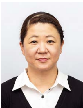
なりた まゆみ 成田 真由美 様

パラリンピアンとして長きにわたり世界トップレベルの選手として活躍し、引退後も国のスポーツ審議会や障害者政策委員会、大学等、幅広い分野の意思決定の場に参画。横浜市においても地域の教育施策やスポーツ振興施策を通じて、男女共同参画の推進に貢献されています。