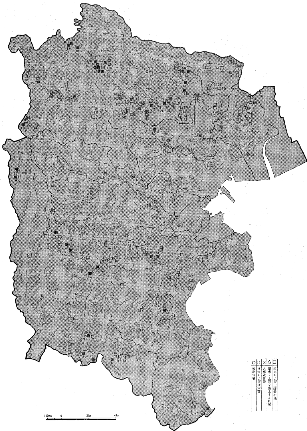
図2 古代集落と墓域の分布