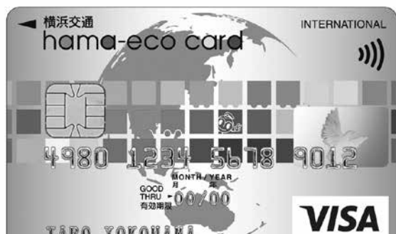
横浜交通 hama-eco カード

このカードで、市営バス・地下鉄の定期券を購入すると翌年度のカード年会費が無料になるほか、「パスモオートチャージ」や電子マネー「iD」にも対応しています。