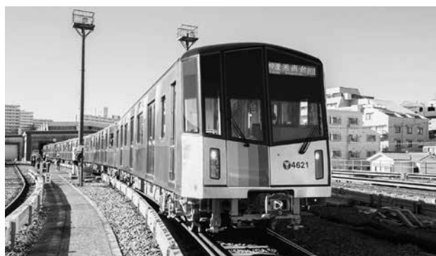
ブルーライン 4000 形車両