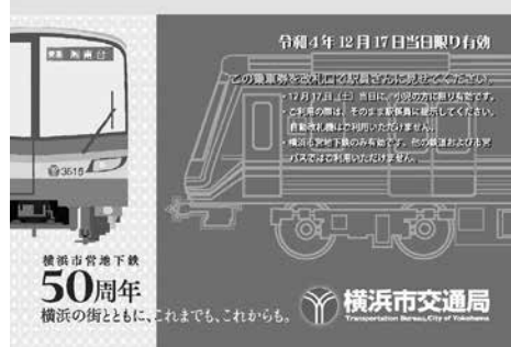
「市営地下鉄開業50周年記念こども無料デー」リーフレット型小児1日乗車券