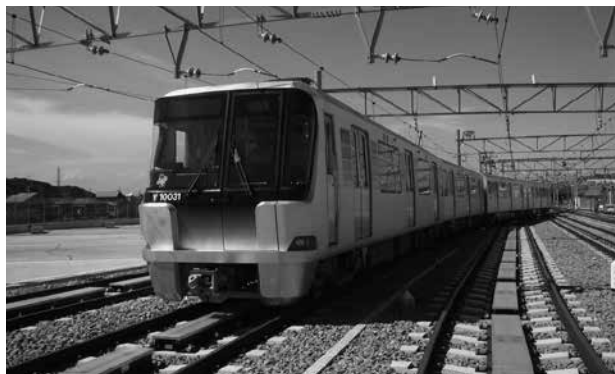
グリーンライン 10000 形車両

トンネル内には限界支障センサーを設置し、センサーが反応した場合は、その反応したエリア内を停電させ、列車を緊急停止させます。また、各車両に4箇所ずつ、非常通報装置を設置しています。通報時に乗務員が対応できない場合は、総合司令所が応答し、車内での非常時の速やかな対応を図っています。