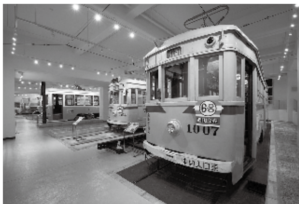
かつて横浜を駆け巡った市電を当時の姿で7両展示

昭和47年に廃止されるまで市民の皆さんの足として親しまれていた横浜市電の車両やパネルを展示しています。また、新たなジオラマゾーン(ハマジオラマ)や横浜の発展と都市交通のあゆみをテーマとした歴史展示コーナーもあります。