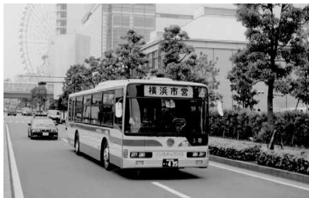
走行中の市営バス