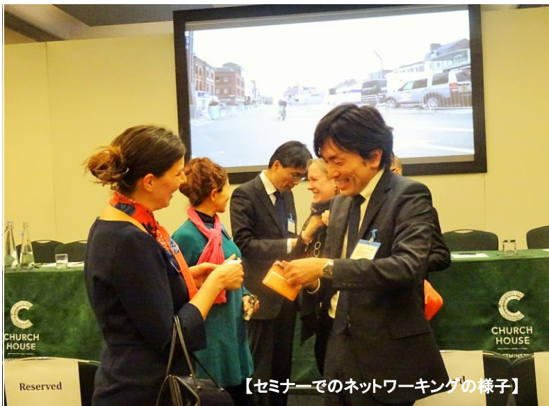
【セミナーでのネットワーキングの様子】

平成 29 年 3 月 9 日 【発行】横浜市国際局政策総務課 企画担当 045-671-3826 ki-somu@city.yokohama.jp