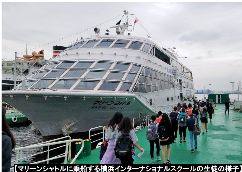
【マリンシャトルに乗船する横浜インターナショナルスクールの生徒の様子】

平成30年6月1日 【発行】横浜市国際局政策総務課 企画担当 045-671-4710 ki-somu@city.yokohama.jp