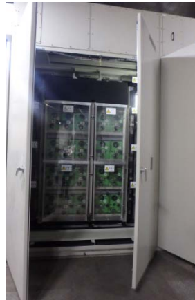
回生電力貯蔵装置(蓄電池盤)