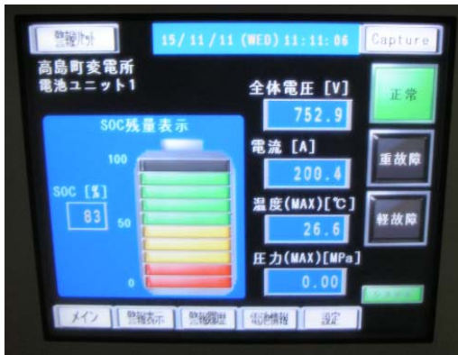
回生電力貯蔵装置(モニタ部)

空調設備が故障すると蓄電池の温度上昇により回生電力貯蔵装置の使用が出来なくなるため、計画的な更新が必要となります。