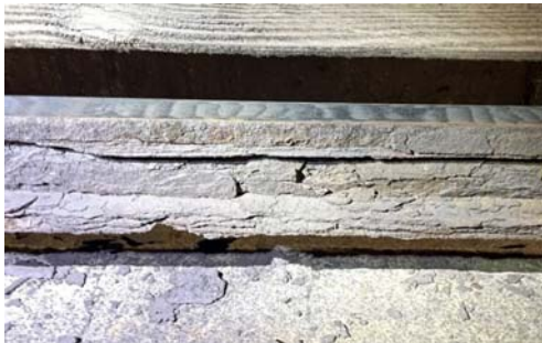
腐食したサードレール