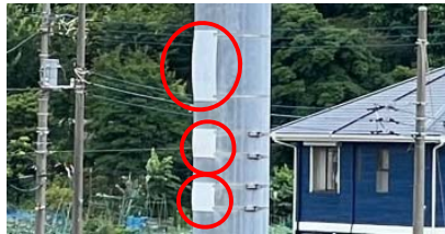
判別不能となった電柱・支持点番号札