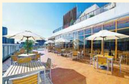
商業機能イメージ

飲食・物販・サービス施設などの店舗を設け、建物内・周辺地域ににぎわいを創り出します。