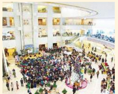
吹き抜け空間イメージ(写真:大崎ゲートシティ)

みなとみらい線馬車道駅に直結する大きな吹き抜け空間であり、街への玄関口となるアトリウムは、「市民の憩いの場」、「式典・イベントスペース」、「芸術・文化」などさまざまな活動が展開される場とします。