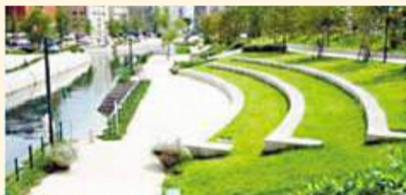
水辺の憩い空間イメージ (写真:長崎水辺の森公園)