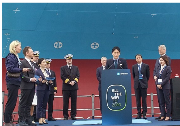
【歓迎挨拶をする山中市長】