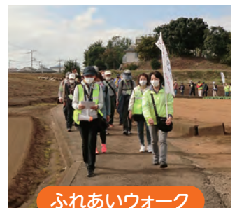
ふれあいウォーク