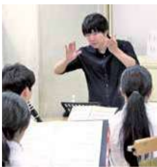
橘中学校でのワークショップ