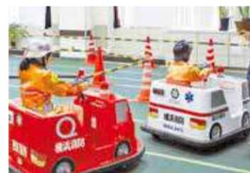
ミニ消防車乗車体験

内容 謎解きイベント、ミニ消防車乗車体験、防火衣装着体験、プレゼント抽選会 など