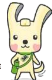
横浜市資源循環局 マスコット「イーオ」