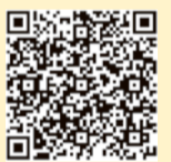
フードドライブとは

「ほどがや朝市」や「ほどがや花フェスタ」、「ほどがや区民まつり」、「区民のつどい」で行っています。