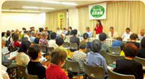
くぬぎ台小学校コミュニティハウスでの「地域のつどい」