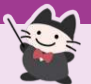
カプッチーズ「コンダ」 かながわアートホール マスコットキャラクター