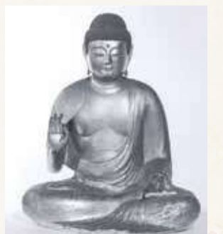
安楽寺阿弥陀如来坐像

『調査概報』掲載のうち、保土ヶ谷区で最も古い像は、安楽寺(西久保町)の阿弥陀如来坐像です。端正に整った像容を示す、平安時代後期、12世紀の像です。安楽寺阿弥陀如来坐像は『調査概報』22号に近年の詳細な調査結果が掲載されています。これに続く中世の作例としては、鎌倉時代後期の遍照寺(月見台)薬師如来坐像、室町時代の法性寺(星川)銅造十一面観音菩薩坐像、室町時代末から桃山時代の作とみられる安楽寺弁財天像、桃山時代の天徳院(神戸町)地藏菩薩坐像があります。それ以外の多くは近世の作とみられ、これらの像や納入品には銘文を残すものもあります。造立・修理時の寄進者や当時の住持の名などがみえ、地域の歴史を物語る文字資料としても重要です。報告書は市内図書館などで閲覧できます。地域の仏像を調べてみると新たな発見に出会えるかもしれません。