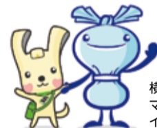
横浜市資源循環局 マスコット イーオ・ミーオ