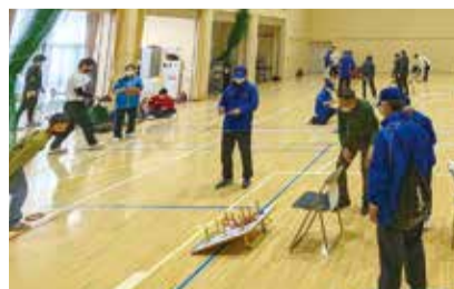
磯子区民輪投げ大会