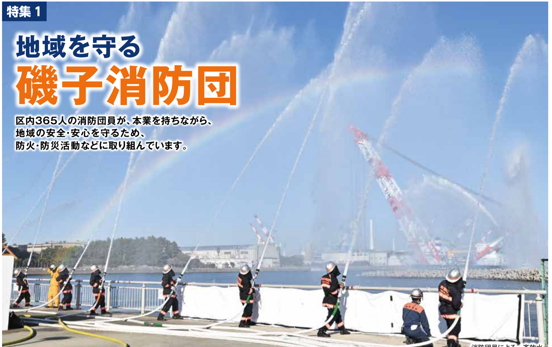
消防団員による一斉放水 (令和6年磯子区消防出初式にて)

区内365人の消防団員が、本業を持ちながら、 地域の安全・安心を守るため、 防火・防災活動などに取り組んでいます。