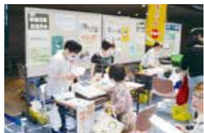
みんなの健康アップフェスティバル

今年度はコロナの影響で断念せざるを得ませんでしたが、国際親善総合病院の協力による「応急処置講習会」や、区主催イベントでの啓発活動を行っています。