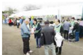
泉区民ふれあいまつり