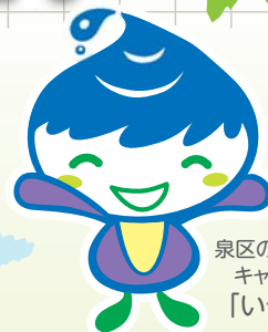
泉区のマスコット キャラクター 「いっずん」

地球温暖化・ヒートアイランド現象抑止の取組の一つとして、「緑のカーテン」普及のための写真展を開催します。皆様が愛情込めて栽培した「緑のカーテン」の写真をぜひご応募ください!!