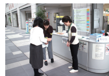
窓口案内ボランティア

区庁舎の環境整備や区民ボランティアによる案内を通じて、区民が利用しやすく親しみやすい区役所づくりを進めます。また、区民の皆様に、様々な情報を的確に提供・発信します。