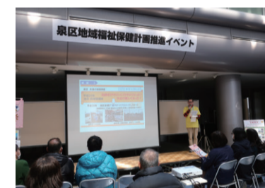
泉区地域福祉保健計画推進イベント