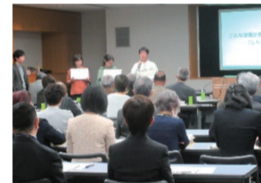
地域協議会の運営

活発な地域活動が継続されるよう、自治会町内会や多文化共生・スポーツを含めた活動支援、担い手支援に取り組み、地域のつながりづくりを推進します。また、地域協議会を運営し、地域の声を施策に生かします。