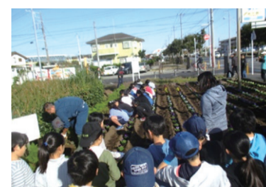
青少年の健全育成