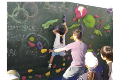
スポーツ活動の支援