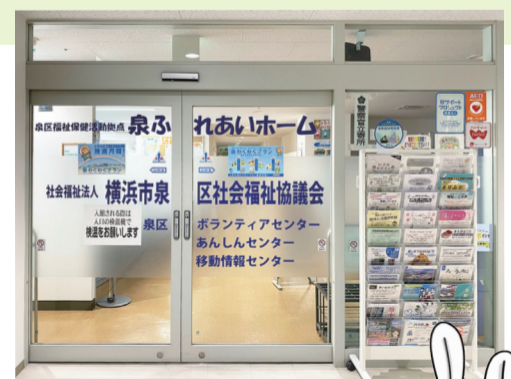
▲このドアが泉ふれあいホームの入口です