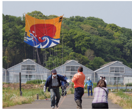
昨年度開催の様子