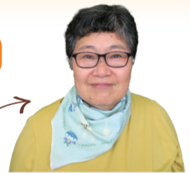
子育て応援サポーターのますこさん