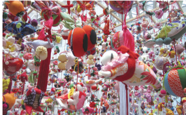
昨年度展示の様子