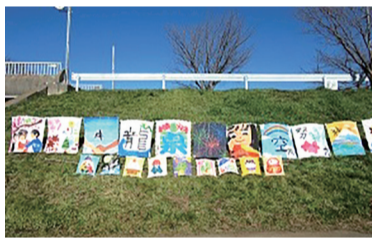
昨年度開催の様子