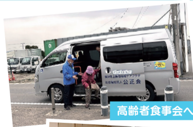
高齢者食事会への送迎