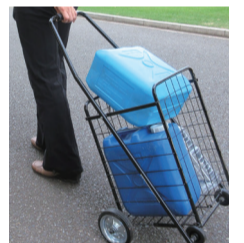
ポリタンクとカート

3. 容器を用意しよう 災害時給水所には容器がないため、必ず持っていく必要があります。ペットボトルやポリタンクなどの容器、リュックサックやカートなどの運ぶための道具を用意しておきましょう。