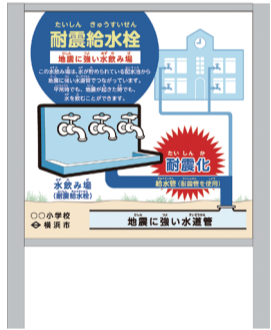
▲耐震給水栓の看板