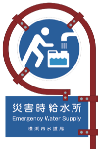
▲災害時給水所の標識