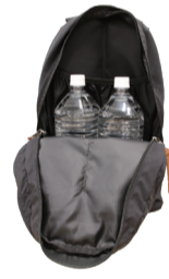
ペットボトルとリュックサック