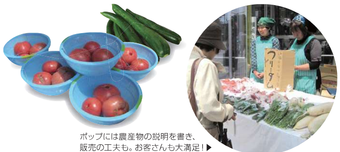
ポップには農産物の説明を書き、販売の工夫も。お客さんも大満足！▶

この取組は、泉区の農産物を多くの人に知ってもらい、味わってもらう「地産地消の推進」と、農産物を販売を通じた障がい者の就労支援を目的としており、売上の一部が福祉団体の収入となります。障がい者の方の手作りクッキーやパンも販売しており、販売日には多くのお客様で賑わいました。