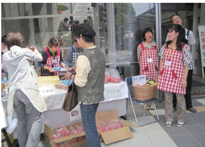
▲最初は緊張気味でしたが「いらっしゃいませ！」と大きな声でピーアール。