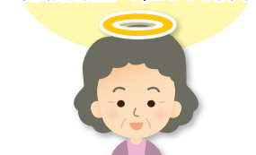
60代で亡くなった奥様