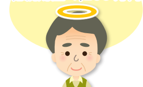
60代で亡くなったご主人