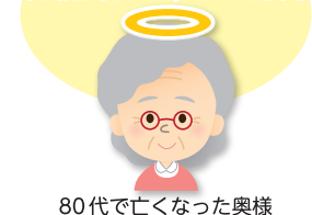
80代で亡くなった奥様