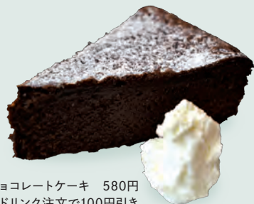
チョコレートケーキ 580円 ※ドリンク注文で100円引き