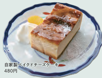
自家製バイクドチーズケーキ 480円