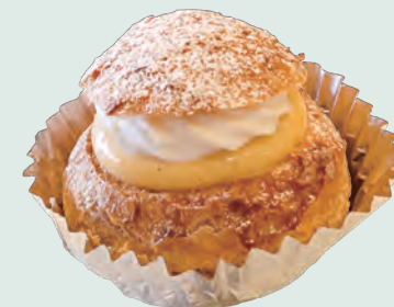
シュークリーム 291円