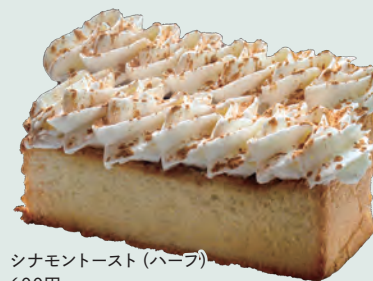
シナモントースト (ハーブ) 600円

コーヒーと合う大人の味わい。 サクサク食感のシナモントースト レトロな雰囲気落ち着く喫茶 店。自家焙煎の豆をサイフォンで 抽出したコーヒーは、「宝石のよ うに美しい味わい」と評判。サク サクのパンに生クリームとたっ ぷりのシナモンが香るトーストは、 コーヒーとの相性抜群な「大人の お菓子」。映えもばっちりの看板 メニューをどうぞ。