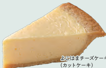
よこはまチーズケーキ (カットケーキ) 540円