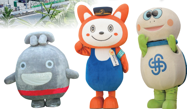
東急線キャラクター のるん