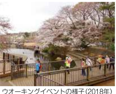
ウォーキングイベントの様子(2018年)