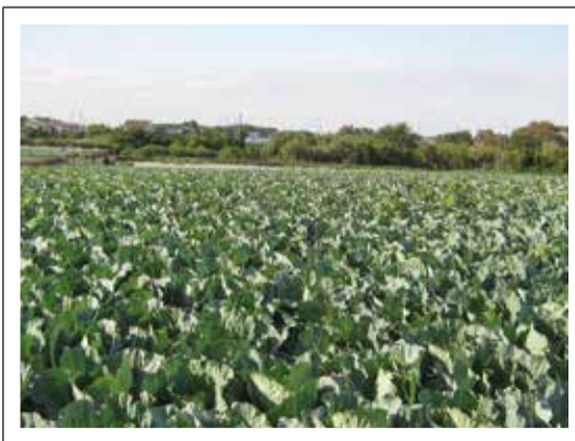
(撮影地:菅田羽沢の農業地域)