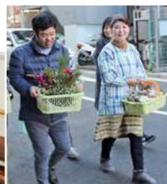
大小合わせて15個の愛情込めて作った「わたし達の愛しいお花」をお届けしています