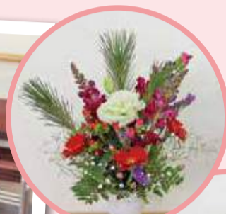
すてきなアレンジメントが完成