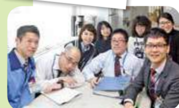
介護保険担当チームみんなで助け合っています