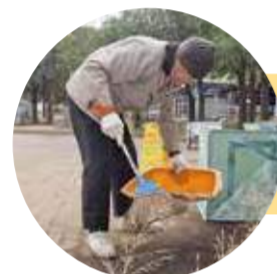
きれいにした公園、大事に使ってね。(Aさん)

今は週2回、「きれいは安心」をモットーに支援者と一緒に清掃活動をしています。公園の管理者から、その日掃除する場所を教えてもらい、主に落ち葉掃除をしています。顔見知りになった子どもたちがあいさつしてくれたり、公園に来る人から声を掛けられることも増えました。「今日もやっつるのね、お疲れ様。ありがとう!」の一言がとてもうれしいそうです。