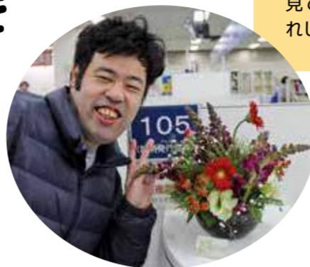
僕たちが一生懸命作っています。見てもらえるとうれしいな。

「お花のデリバリー」は、区役所が神奈川区障害者地域作業所連絡会に委託している事業です。区内にある8つの事業所(浦島共同作業所、ぐりんろーど、青桐茶房、せせらぎ、たんまち福祉活動ホーム、もくもく、リワーク神奈川、わかば工芸)が順番で、毎週月曜日に区役所の窓口にお花を飾っています。