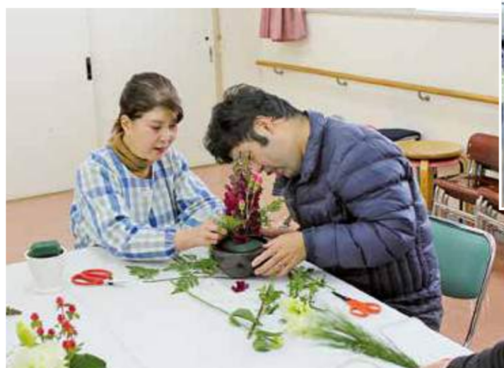
ボランティアの先生と一緒に作ります。メンバーの感性や創造力で、すてきなアレンジメントが生み出されています