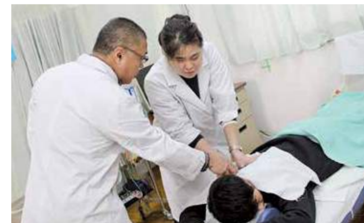
先生の指導を受けて上達を目指します

*ヘルスキーパー…国家資格を有する視覚障害者があん摩マッサージ・指圧・はり・きゅうなどの施術を行う職種。企業が福利厚生の一環として取り入れ、業務中に生じた疲労等を取り除き、健康増進と作業効率の向上を目的としています。