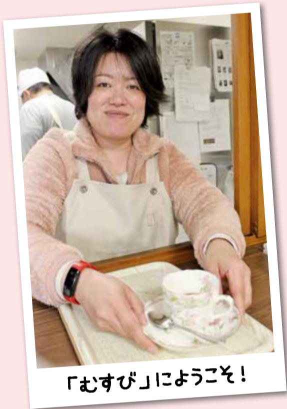
「むすび」によるこよ!