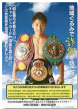
特殊詐欺防止啓発ポスター

※「自動通話録音装置」…着信音が鳴る前に相手方に自動で警告メッセージを流し、通話を録音する装置です。