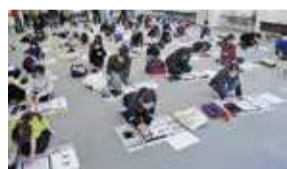
書き初め大会の様子→

1月12日・19日に行われた「子ども会新春書き初め大会」に、区内の小・中学生75人の皆さんが参加しました。