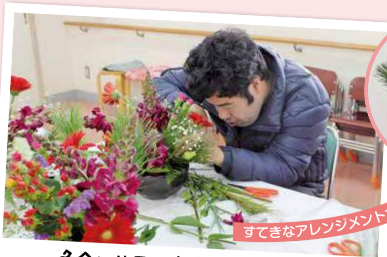
色合いや形に気を付けています