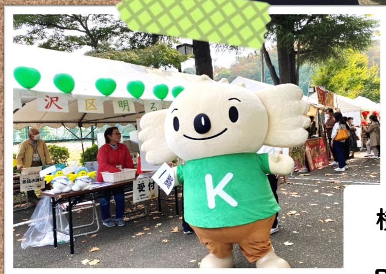
横浜市立大学 「浜大祭」 R5.11.5(土)