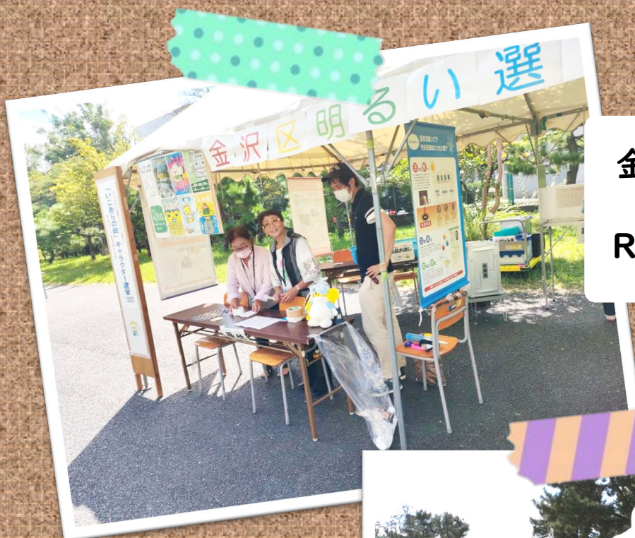
金沢高等学校 「金高祭」 R5.9.10(日)