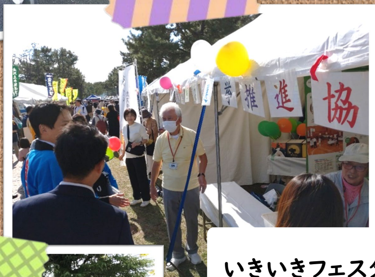
いきいきフェスタ R5.10.21(土)