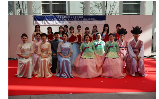
「ジョイントコンサート 2023 in YOKOHAMA」での公演