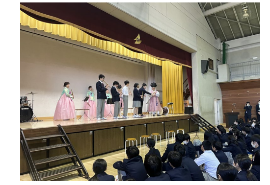
茅ヶ崎中学校での交流