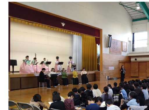
新鶴見小学校での交流