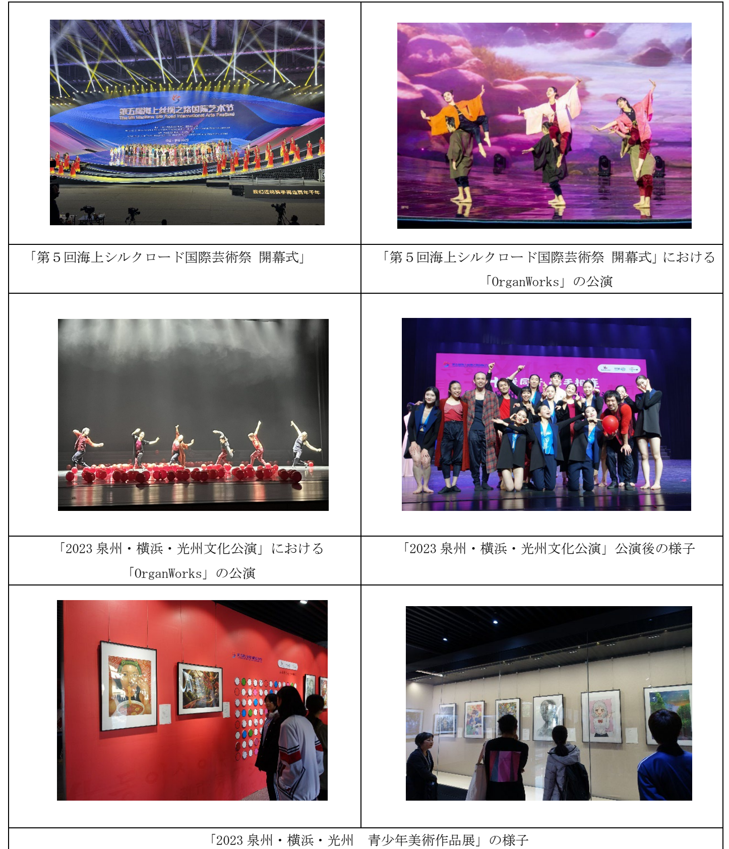
「第 5 回海上シルクロード国際芸術祭 開幕式」

(ウ) 「2023 泉州・横浜・光州 青少年美術作品展」への出展 展覧会開催期間：令和 5 年 12 月 7 日～令和 6 年 1 月 7 日 会場：泉州市博物館 横浜市からの出展：神奈川県立上矢部高等学校 10 作品 神奈川県立白山高等学校 7 作品