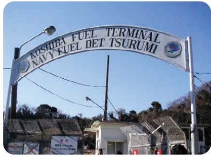
返還直後の基地ゲート