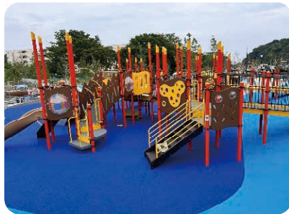
スロープ付き遊具

障害の有無などにかかわらずすべての子どもたちが一緒に遊ぶことを目指した、横浜で初めての「インクルーシブ遊具広場」です。障害のある方や専門家のご意見をもとに、車いすのまま使える遊具などを整備しています。様々な難易度や特徴をもった遊具を配置し、それぞれの子どもがお気に入りの遊具を見つけられるようにしています。また、トイレや休憩スペース、外周の飛び出し防止フェンスなど、遊具以外の施設についても仕様を工夫しています。