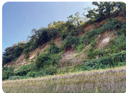
海食崖と待受擁壁