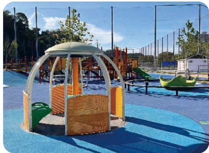
車いすのまま乗れる遊具