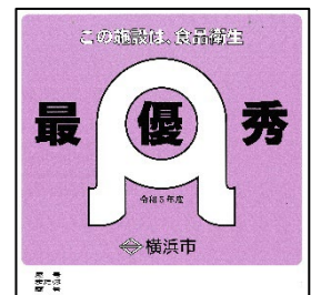
最優秀施設認定証 (市長表彰)