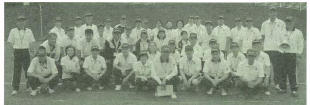
▲体育指導委員新任者

新任体育指導委員の方にはこの研修で得られた内容をベースに、体育指導委員として今後の地域での活躍を期待いたします。