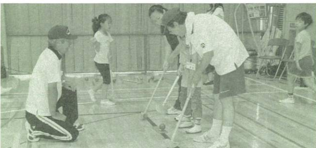
▲グラウンドゴルフ

また、キャプテンわん・マリノスケのキャラクター2体が出演し、子供と握手をしたり記念撮影をしたり、フェスティバルの楽しい気分を盛り上げていました。