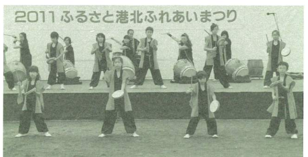
▲大曽根夢太鼓どどん鼓