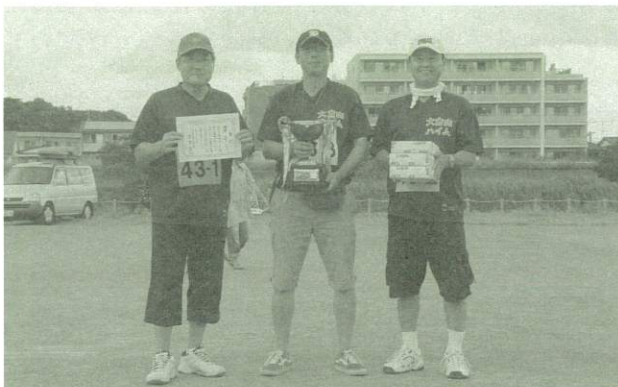
▲ペタンク大会優勝チームの皆さん