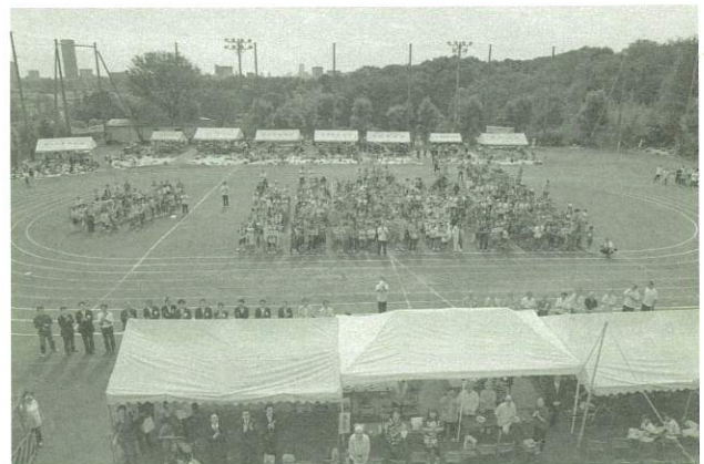
▲2時間遅れで、無事に開催