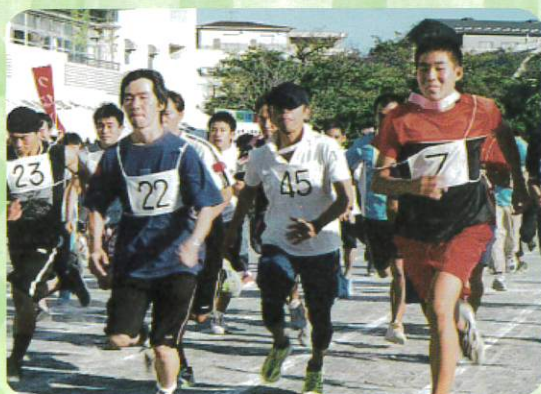
持久走 一般男子の部 (約2Km)