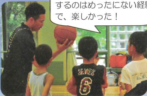
バスケットボールクリニック