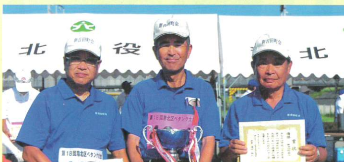
優勝した新吉田町会 A チーム