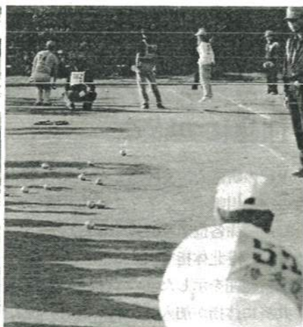
熱戦の続いた午後のトーナメント戦