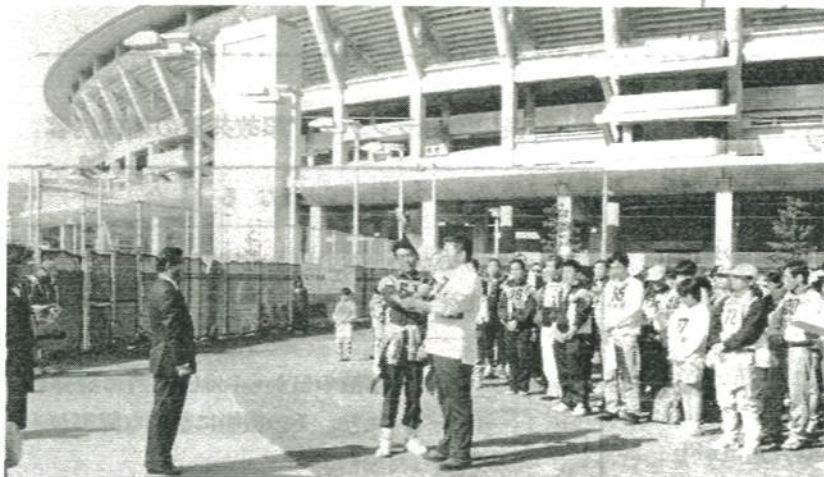
前回優勝の新羽トマトチームが力強く選手宣誓

事務局 港北区大豆戸町26-1 港北区役所地域振興課内 ☎ 045-540-2240 FAX 045-540-2245