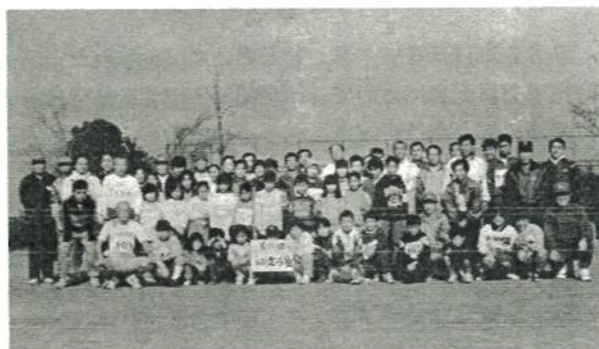
毎月第2日曜日実施の“走ろう会”