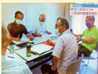
冊子作成時の様子(写真:NHKテレビより)

昨今、異常気象により日本各地で大災害が続く中で、 自分たちが住む地区の災害に対する正しい認識と備えの必要性 を感じ、私たちは河川防災に関する講座を受講しました。この講座では、情報収集手段から、地域のどこに危険性があるのか等まで幅広く学びました。講座を踏まえ、この内容を広く共有するため、 水害対策冊子を作成し地域の皆さんに配布しました 。地域の皆さんからは「災害時の状況や正しい避難行動を初めて知ることができた」、「地元の特化した内容で身近に捉える事ができた」等の意見が寄せられました。この取組で、災害時の被害を少しでも減らすことができれば良いと思います。