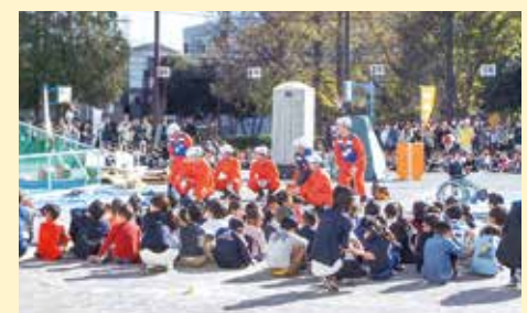
太尾小学校での訓練の様子(2019年撮影)

災害時には、一人の力では助かることができない場面がどうしても生まれてしまいます。そのような状況を打開できるように、今後も多くの住民が参加したくなり、つながりが生まれるような活動を進めたいと思います。