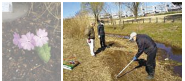
サクラソウプロジェクトのお手伝い(新横浜公園)

◆地域ケアプラザとは…高齢者、子ども、障害のある人など誰もが地域で安心して暮らせるよう、身近な福祉・保健活動の拠点として、さまざまな取組を行っている横浜市独自の施設です。