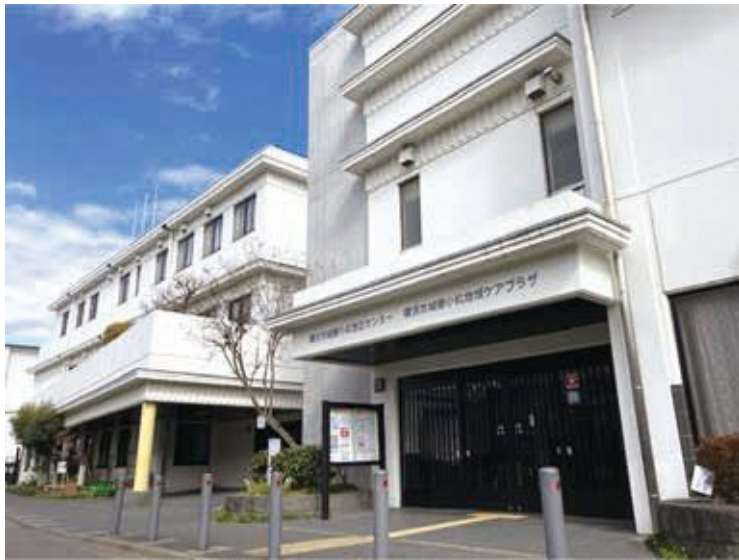
城郷小机地域ケアプラザ 外観

住所:横浜市港北区小机町2484-4 電話:045-478-1133 FAX:045-478-1155 開館時間:月曜日～土曜日 9時～21時 日曜日・祝日 9時～17時 休館日:毎月第4月曜日および年末年始 年末年始休館日 12月29日～1月3日 交通:JR横浜線「小机駅」下車 徒歩1分 バス停「小机駅前」下車徒歩1分 ※ 貸室の利用にあたっては、施設にお問合せください。