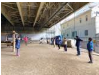
堀崎は一列に並んで