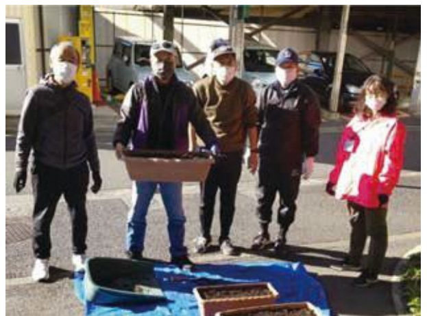
育てる緑のみなさん

4月15日(金)から始まる第10回港北オープンガーデンにも参加しますので、是非お立ち寄りくださいとのことでした。