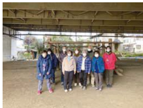
堀崎町子供の遊び場にて

「ハマトレ」は、ロコモ(ロコモティブシンドローム)を予防するために横浜市が高齢者の「歩き」に着目して開発したトレーニングです。横浜市歌を口ずさみながら、気軽にトレーニングができます。