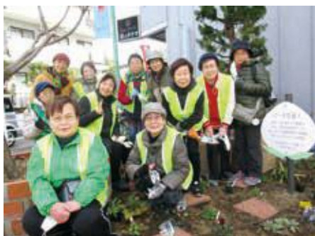
「港北みりよく発見団」の皆さん