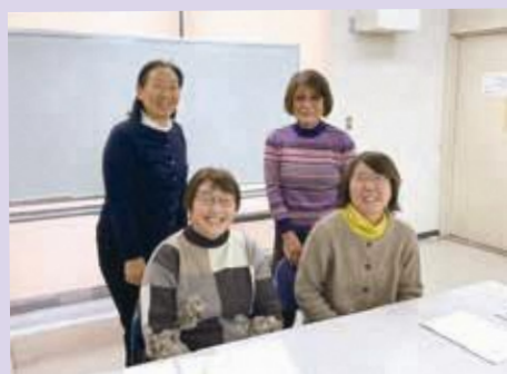
介護を考えるぶどうの会のみなさん