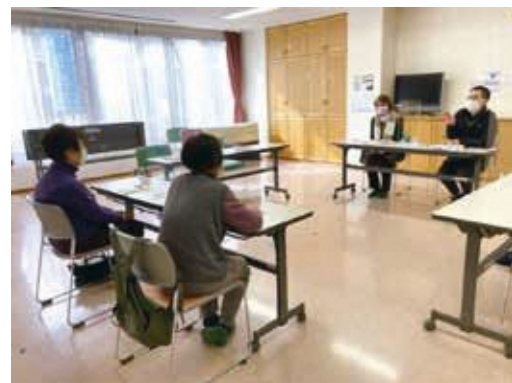
介護者のつどいの様子

事前の申込は不要。現在介護をしている方や介護経験者ならどなたでもご参加いただけます。お気軽にご参加くださいとのことでした。