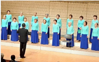
【せやあじさいコーラス】