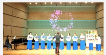
【楽歌声(らっかせい)】