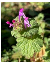
ほとけのざ