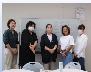
楽しい韓国語サークル