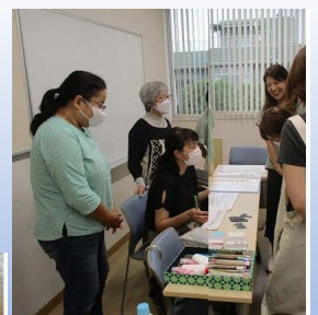
カリグラフィーの世界