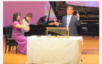
【アンサンブル・ミルブランタン】