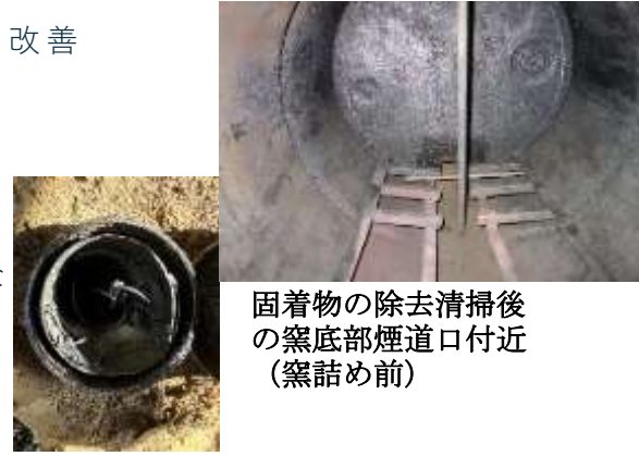
固着物の除去清掃後の窯底部煙道口付近（窯詰め前）

結果 煙道口で 330℃、窯下部で 830℃まで上昇し、終盤では若干の煙のバックフローが起きたものの確かな精錬を示すブルーフレームを長時間観察できた。出炭率、良炭率も以前と同様の域まで戻すことができた（温度管理グラフ掲載の数値を参照）。次回は上記（工夫2）内部煙突の効果の有無を調べるため、外した状態で確認実験を実施する予定である。