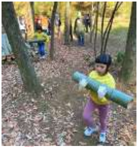
竹炭作りには竹は必要で