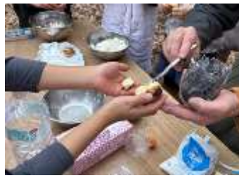
パンに炭バターぬって