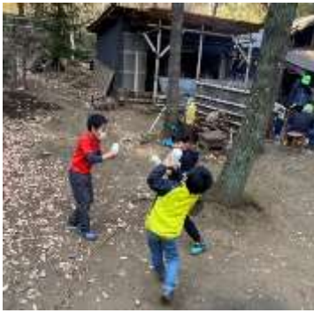
ふってふって、バター作り