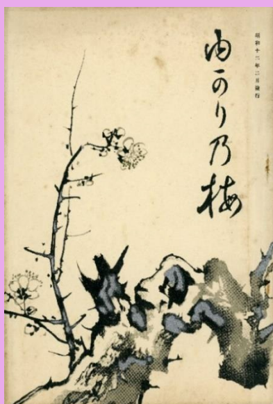
『ゆかりの梅』第38号(1937年2月)