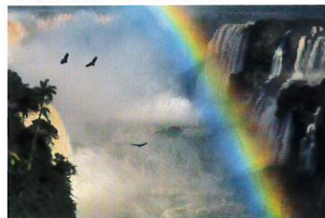
イグアス国立公園[アルゼンチン・ブラジル]2018年