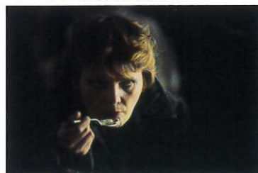
厳冬のツンドラ平原に広がる収容所の女性囚人[ハバロフスク近郊] 1992年