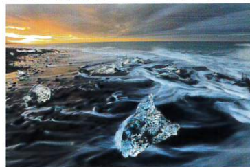
ヴァトナヨークトル国立公園[アイスランド]2018年