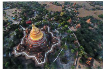
バガン遺跡[ミャンマー]2020年