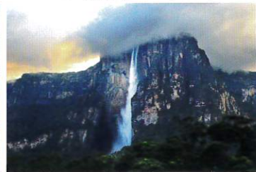
カナイマ国立公園[ベネズエラ]2020年