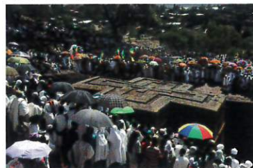
聖地ラリベラの岩窟教会 2010年