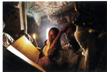
聖書を読誦する司祭たち 2012年