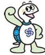
神奈川県マスコット キャラクターかめ太郎