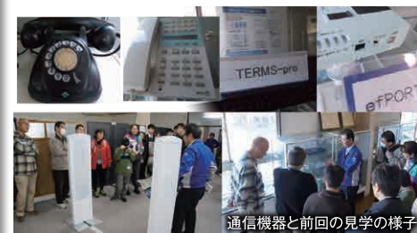
通信機器と前回の見学の様子