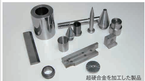
超硬合金を加工した製品