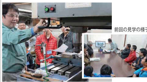
前回の見学の様子