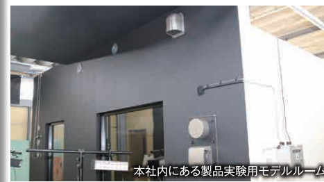
本社内にある製品実験用モデルルーム