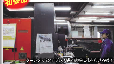
ターレットパンチプレス機で鉄板に孔をあける様子