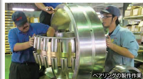
ベアリングの製作作業