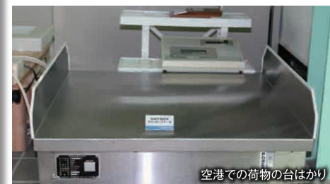
空港での荷物の台はかり