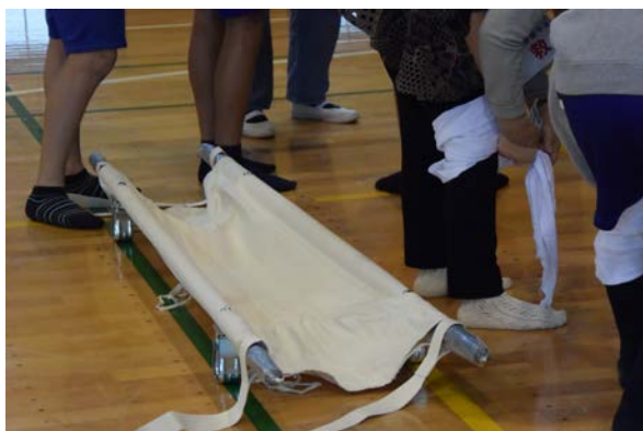
【担架による搬送訓練】