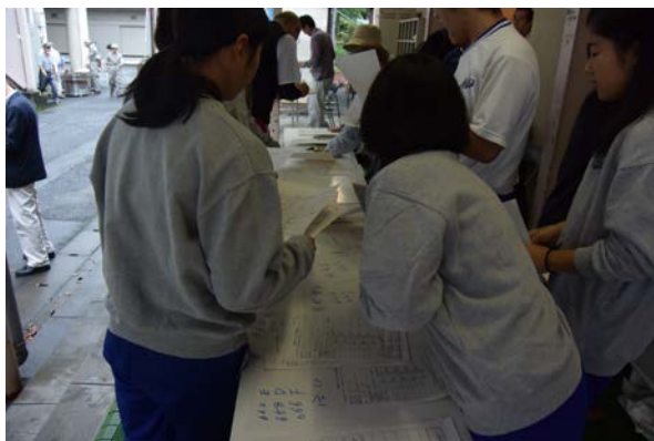
【避難所の受入れ訓練】

運営委員会のメンバーが、被災者の受け入れ、炊き出し、応急手当などの訓練に加え、野庭地域ケアプラザと連携し、デジタルトランシーバーを使った要援護者の搬送訓練も行っています。中学生も参加し、HUG 訓練、搬送訓練では大活躍です。