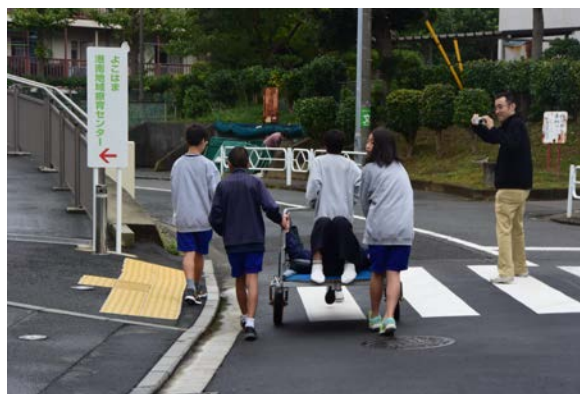
【特別避難場所搬送訓練】