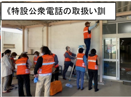
《特設公衆電話を取扱い訓