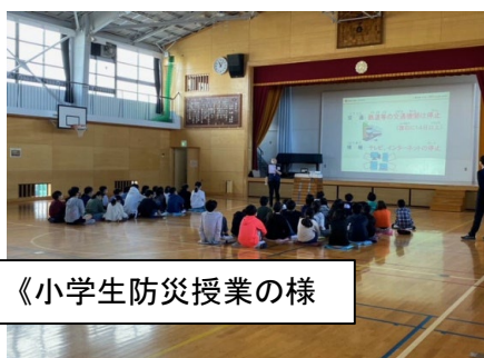
《小学生防災授業の様