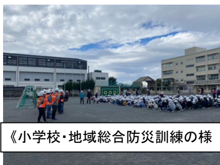
《小学校・地域総合防災訓練の様