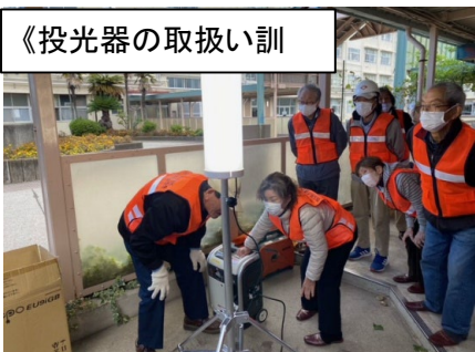
《投光器を取扱い訓