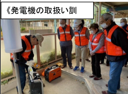
《発電機を取扱い訓