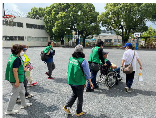
福祉避難所搬送訓練