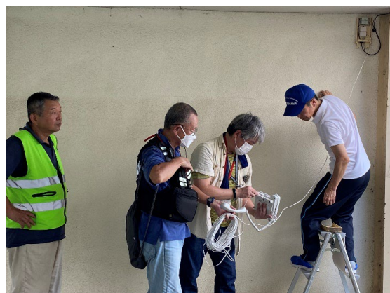
特設公衆電話設置訓練