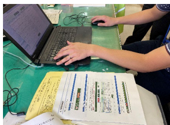
災害時安否確認システム入