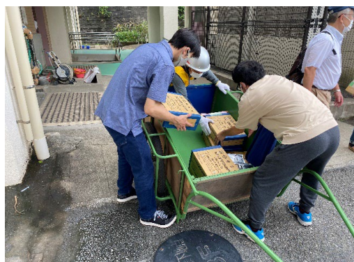
救援物資運搬訓練