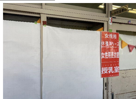
授乳室、女性更衣室スペースづく