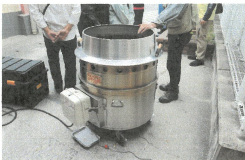
まかないくん（移動式炊飯器）による炊き出し