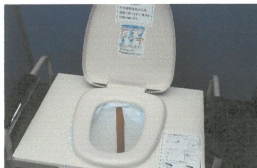
下水管直結トイレ設置