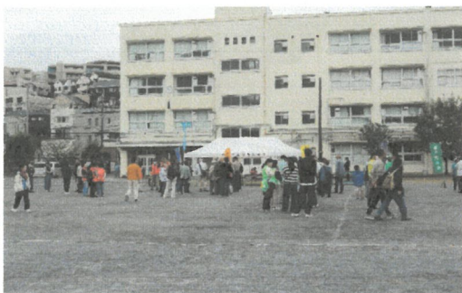
町内会ごとに整列