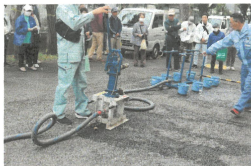
災害用地下給水タンクから水を確保