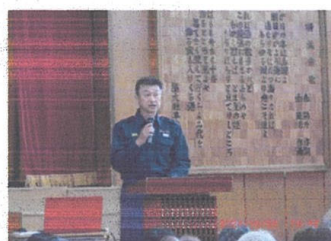
村木消防署員防災講話