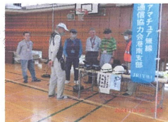
無線班:訓練開始連絡