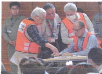
避難者人数確認集計