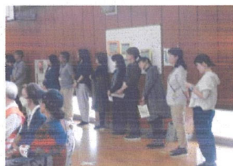
役所・学校関係運営委員