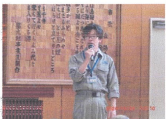
福井副委員長挨拶