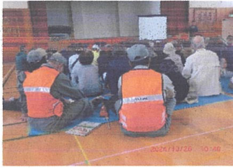
防災拠点開設運営学習