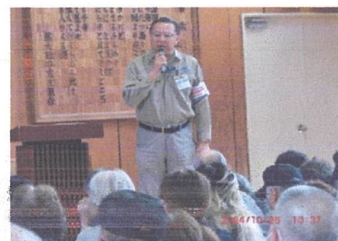
栗原港南区長挨拶