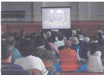
防災拠点開設運営学習