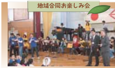
地域合同お楽しみ会