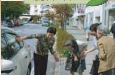
送迎ボランティアーズ