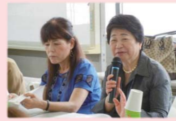
(協議会でのご意見)

港南区の保健・医療・福祉等の連携強化を図り、地域における総合的な福祉保健サービスを円滑に行うことを目的に設置。第3期プランについては、地域の代表者と、区役所・区社会福祉協議会が一緒になって、プランを検討する場となりました。